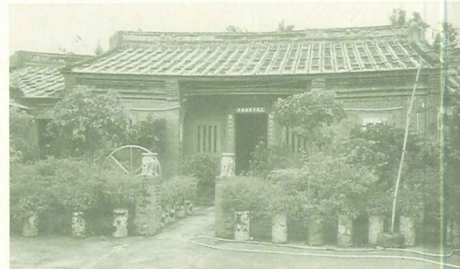
大屯溪畔的古厝至今完整保留的已不多。

一個富有歷史的、生態的與觀光休閒的大屯溪流域，真是令人嚮往的夢土，我相信在這麼多好鄉親的支持與參與下，一定可以實現。