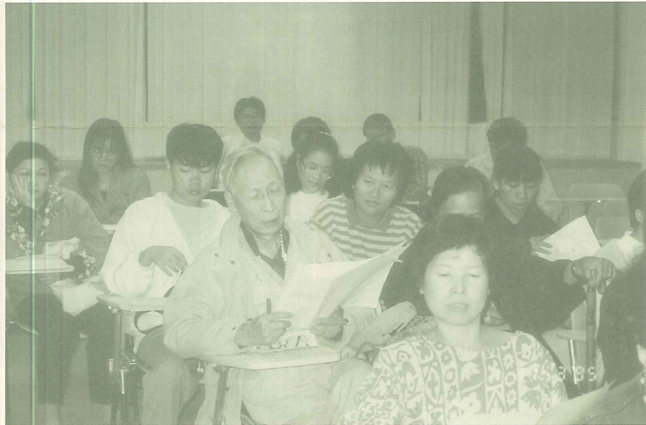
往年參加學員許多是外地慕名而來的，這對淡水居民是極可惜的一件事。

淡水是臺灣少數的「詩美之鄉」，曾有過興盛的人文環境，也曾留下許多可貴的文史資料；我們這一代淡水人應該珍惜這個文化傳統，踴躍參與漢文班的研習，培養、涵具優雅的母語文化，多多吟唱鄉土的人文詩作，讓淡水人能自傲的說，他們的故鄉永遠是一個「詩美之鄉」。