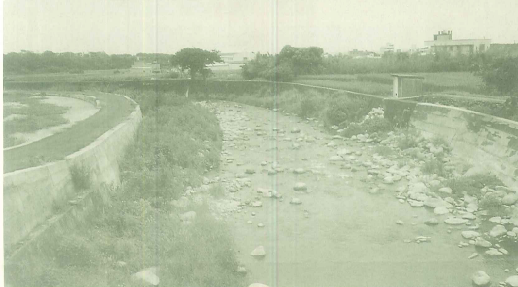
現今堤工程後影響甚大。