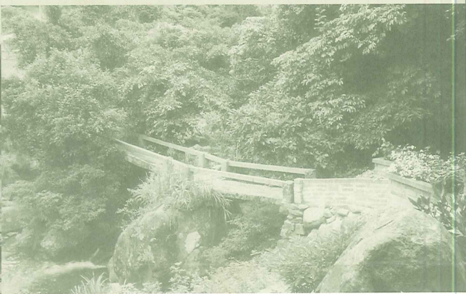
三板橋仍保留有古樸的面貌與盎然的綠意。