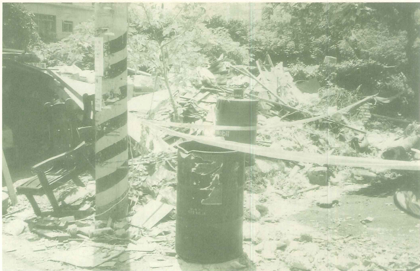
路邊隨處可見垃圾推積，難道我們淡水人的尊嚴已不復存在了嗎？

小時候，大家成群在淡水河中嬉戲的記憶尚未褪去，但現在外地人對淡水河的印象，就只有髒亂的黑色河水；根本無法想像淡水河有著我們童年的