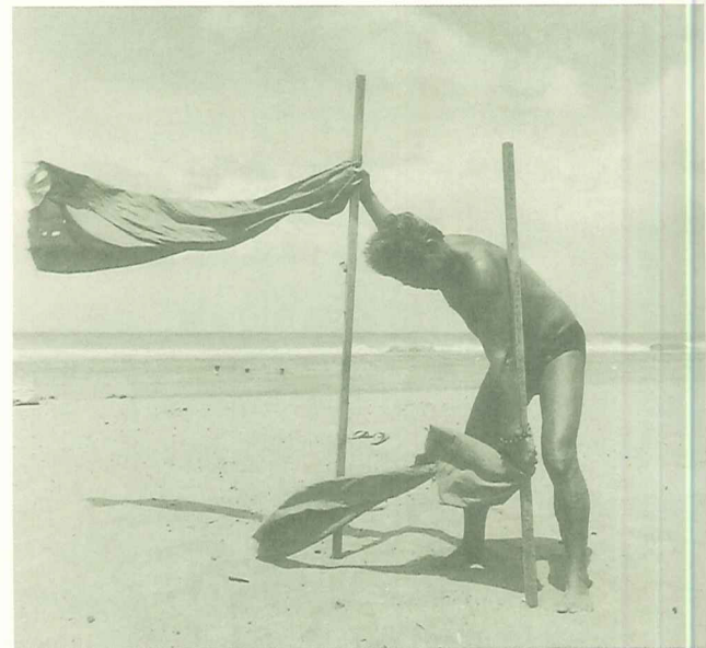
海海人生—吳志華攝影展

歡迎賜稿，來稿請附上真實姓名、詳細戶籍地址、聯絡電話及職業，寄淡水鎮中正路161號或傳真6202355